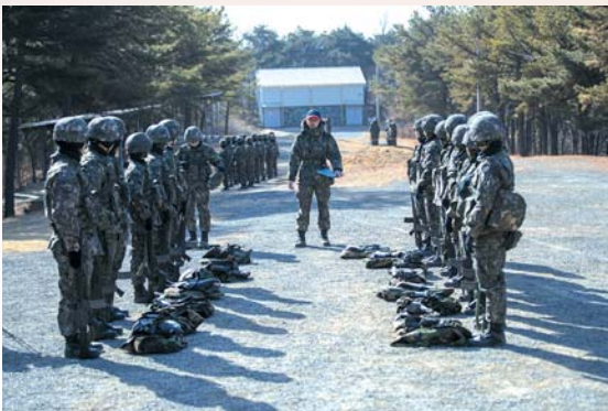
▲ 화생방훈련에 앞서 조교가 설명을 하고 있다.