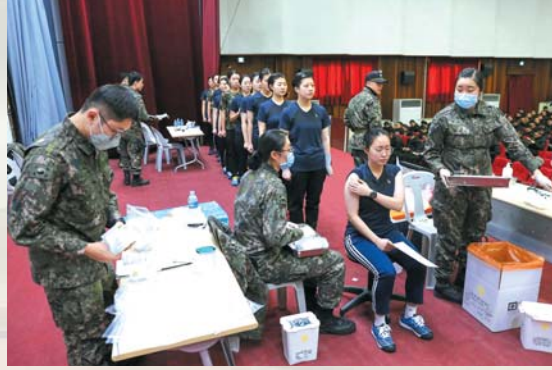
▲ 생도들의 건강을 위해 예방접종을 받고 있다.