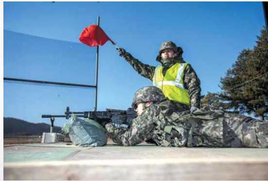
▲ 개인화기 사격간 통제에 따라 한발 한발 사격을 하고 있다.