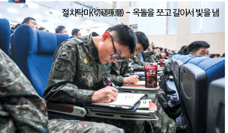
절차탁마(切磋琢磨) - 옥돌을 쪼고 갈아서 빛을 냄