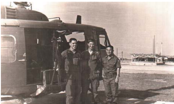
▲ 베트남에서 연락장교로 근무하던 시절

A 감사합니다. 육군 간부후보생 181기로 임관하여 21년 복무 후 전역하고 사회에서 11년간 직장 생활을 하다가 창업하여 25년간 회사를 경영하고 있는 중견기업 인입니다.