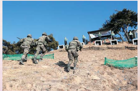
▲ 각개전투 훈련간 생도들이 고지점령을 위해 달려가고 있다.