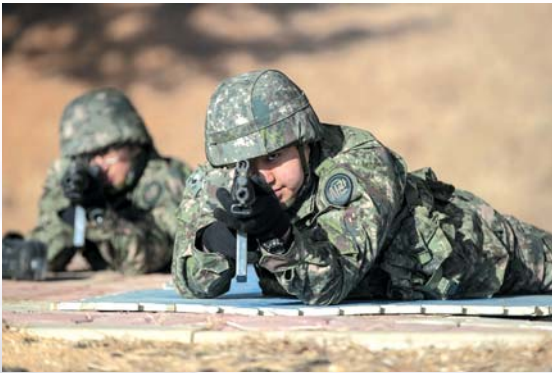
▲ 개인화기 사격에 앞서 사격술에비훈련(PRI)을 받고 있다.