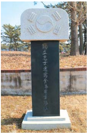
▲ 독립지사일와 김낙헌 사적비

2019년 을해년(乙亥年)은 1919년 기미년(己未年) 3.1만세운동이 일어난 지 꼭 100년이 되는 뜻이 깊은 해이다. 그래서 올해 ‘명문가를 찾아서’의 집필 방향은 3.1운동 관련 집안 또는 애국지사를 소개하고자 한다.