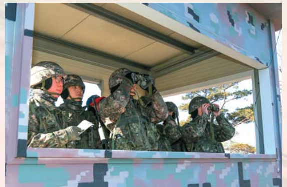
▲ 경계 훈련에 임하며 전방을 응시하고 있다.