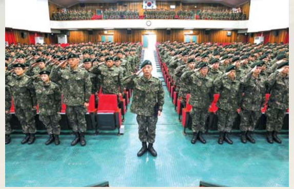
▲ 충성 기초훈련 가입 교식간 단체 경례를 하고 있다.