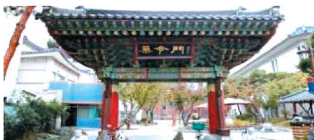
▲ 약령시 한의약박물관입구

이곳 근대골목을 걷다 출출해지면 대구 도심의 빵지 순례길을 찾아가자. 대구에서 가장 긴 역사와 전통을 자랑하는 'OO베이커리', 근대골목 여행의 주전부리 명소로 떠오른 '대구근대골목OO빵',