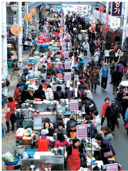
▲ 서문시장 풍경

놀고 먹고 즐기는 추천여행지 대구편 세 번째는 서문시장을 소개하려 한다. 골목마다 별미가 가득한 서문시장은 지하철 3호선을 타고 서문시장역 3번 출구로 나오면 만날 수 있다. 경북 최대의 시장이며 대구의 관광 명소 중에 하나인 이곳은 고객층이 넓어지면서 서문시장에 활력이 넘치고 있다. 시장 골목을 누비다 보면 다양한 먹을거리와 맛있는 곳이 아주 많다.