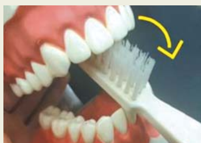
▲ 앞니의 안쪽은 칫솔을 곧바로 경사지게 넣어서 안에서 밖으로 큰 원을 그리듯이 훑어냅니다