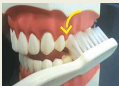
▲ 윗니는 위에서 아래로 아랫니는 아래서 위로 손목을 돌리면서 쓸어내리거나 올립니다