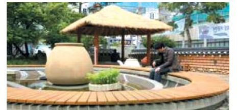
▲ 약초 족욕탕

반월당역 16번 출구에서 나와 달구벌대로 415번길 도보 약 10분을 걸어가면 약령시한의약박물관이 보인다. 전국의 한의대생은 물론, 관심있는 사람들은 약령시의 역사와 발자취를 살피거나 한방 체험실에서 한방 원리 탐험과 한방 체험을 하곤 한다. 마당에는 100여 명이 함께 할 수 있는 약초 족욕탕이 있어 날씨가 좋으면 서문시장과 근대골목을 돌아보는 관광객들에게 지친 발걸음을 쉬기에 안성맞춤이다. 400년 역사를 자랑하는 약령시의 과거와 현재, 미래를 만나는 이곳