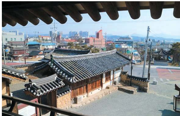
▲ 영천 향교, 이곳에서 10시 방향에 창구동이 보인다.