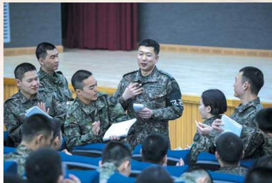
▲ 교관과 생도들이 Why? 캠페인 방법을 적용하여 토의하고 있다.