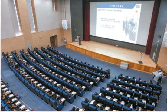
▲ 자신이 배울 전공에 대한 소개 교육을 받고 있다.