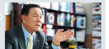
07 생도광장 | 우리들의 이야기 포토스케치