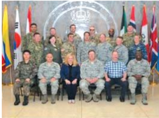
▲美 합참대교육 중 교관, 학우들과 기념촬영을 하고 있다.

6.25전쟁의 전세를 역전시킨 인천상륙작전과 지평리전투 등 전사(戰史)에서도 볼 수 있듯이 승리한 전투와 전쟁에는 유기적인 작전이 큰 몫을 했다. 둘째, 안보환경의 변화에 따라 특정 국가에 의한 위협뿐 아니라, 잠재적국, 폭력집단, 테러, 재해·재난 등 다양해진 위협에 대응하기 위해 국가기관 및 다양한 조직 간 협력이 요구되는 연합·합동작전은 미래에도 더욱 요구된다는 것이다.