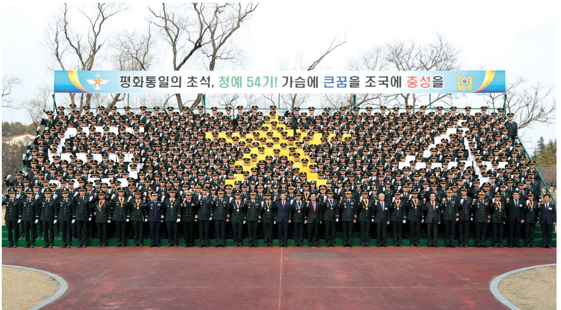
▲ 54기 사관생도들은 정경두 국방부장관 주관으로 학교 연병장에서 졸업 및 임관식을 갖고 야전에서 즉각 임무수행이 가능한 최정예장교로 거듭났다.