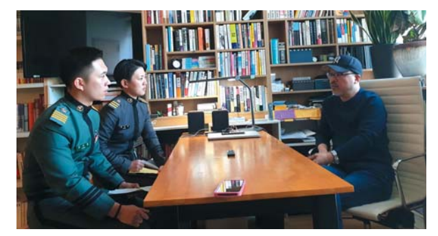
ℚ 현재 만화협회 회장, 누룩미디어 대표, 새로운 장 르 도전 등 다양한 일을 하시는 것 같습니다. 이러한 열정이 어디서 나오는지 궁금합니다.

▲ 작품을 만드는 과정은 꽤나 공학적인 단계입니 다. 저는 그 '로직(Logic)'이 중요하다고 생각해요. 첫 번 째, 테마가 잡혀야 해요. 장기적으로 작업의 시작부터 끝까지 유효한 가치일까, 유효한 테마일까 이게 제일 중요해요. 두 번째는 제목을 정해요. 제목이 존재해야 만 작품으로서의 존재가치가 있어요. 세 번째는 등장인 물을 만들죠. 그러면서 그 사람의 히스토리를 만들어 요. 언제 어떤 도시에서 태어났고, 어떤 가정환경에서 자랐는지. 저는 창작을 하는 사람이지 창작을 제일 잘 하는 사람이 아니에요. 저는 대중작가지만 오히려 대중 문화를 접할 시간이 없으니까 가장 멀리 떨어져 있어 요. 바둑도 옆에서 훈수 두는 사람이 더 잘 본다고 하듯 이 대중들이 더 잘 봐요. 그러니 최소한의 방어를 하려 면 내 등장인물을 누구보다 잘 알아야 하고, 등장인물 을 구상하다보면 이야기가 서서히 생겨요. 이러한 플롯 (Flot)이 생기면 순서를 뒤섞어 봐요. 어떤 것이 먼저오 고 나중에 오는 것이 더 좋은지 고민하는 과정이죠. 그 러면서 클라이맥스를 정하는데 보통 사건의 크기가 큰 것이나 이야기의 뒷부분에 오는 것이 클라이맥스라 생 각하지만 클라이맥스는 '작품이 이런 얘기를 하려고 했구나' 하는 기승전 개념에 대한 해소입니다. 작품을 만들어갈 때는 이런 식으로 공학적인 과정을 풀어가는 것이 중요합니다.