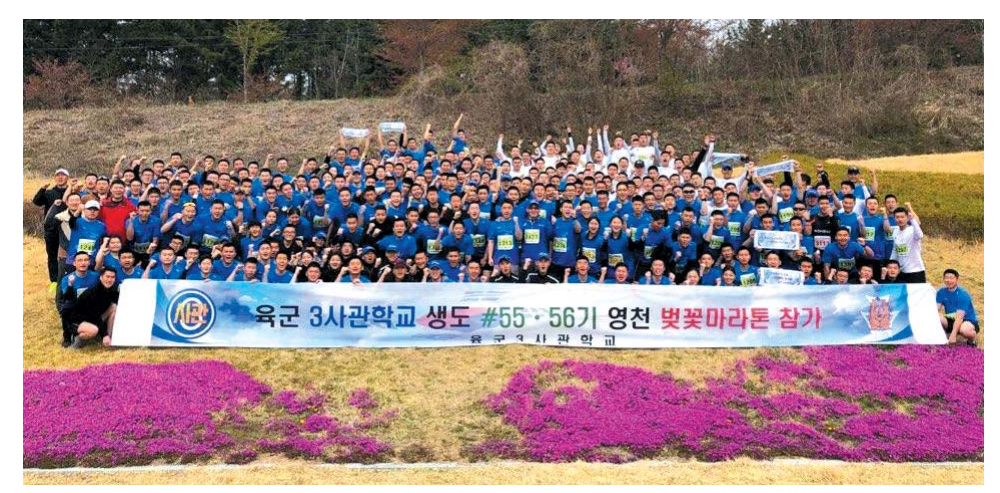
▲ 영천 벚꽃미라톤에 참가한 간부 및 사관생도들의 기념 쵤영