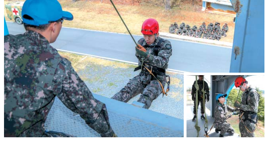
▲ 충성대 시관캠프에 입소한 고등학생들이 헬기레펠 훈련을 체험하고 있다.