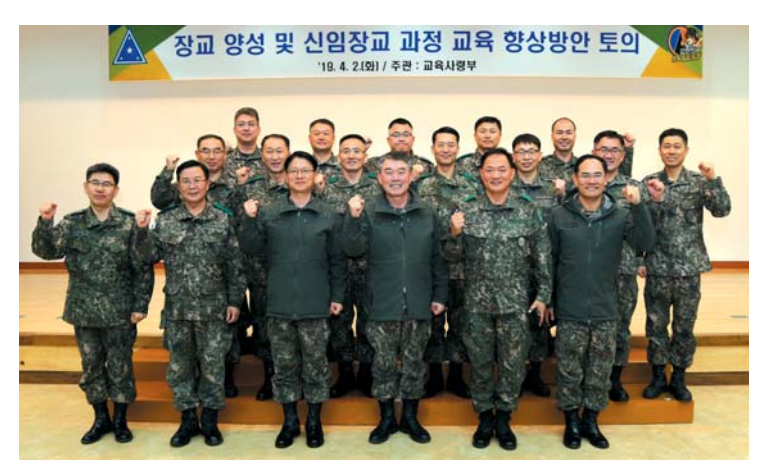
▲ 육군교육사령관(중앙 우측), 학교장(중앙 좌측) 등 토의에 참여한 관계자들이 행사후 기념 촬영을 하고 있다.

2시간에 걸쳐 진행된 토의에서 각학교별 교육목표 및 중점과 군사학 교육기간 · 과