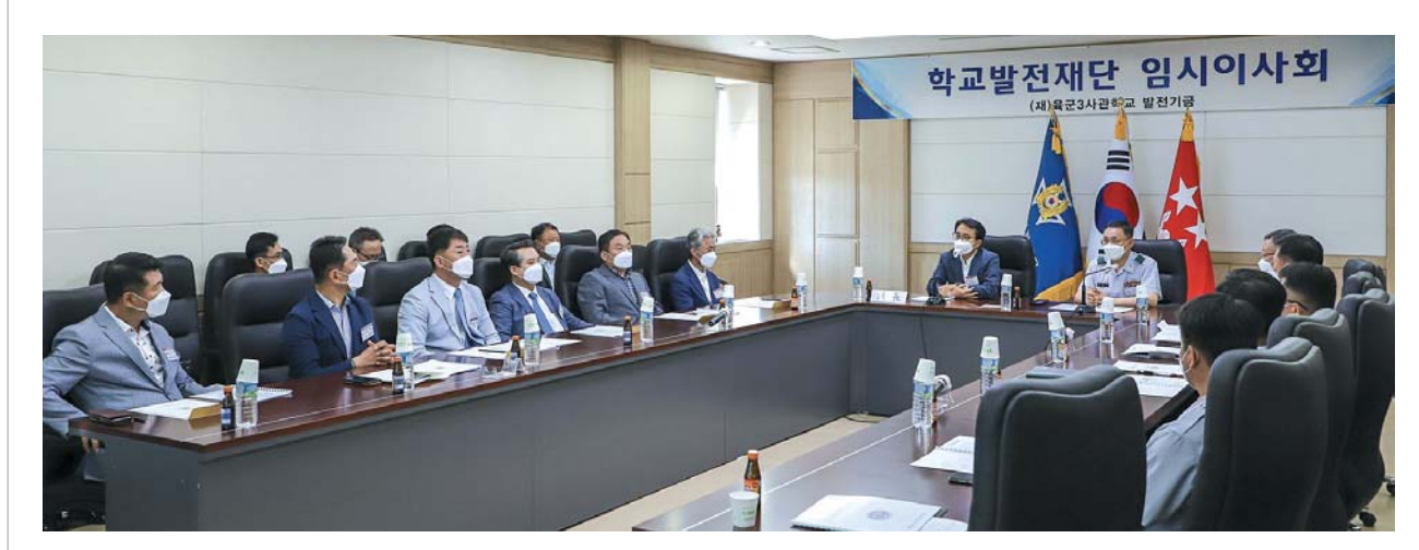
학교 주요활동을 소개에 이어 의견을 나누고 있는 참석자들