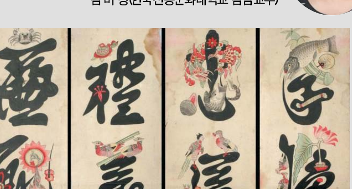
문지도 〈조선대학교 박물관소장〉