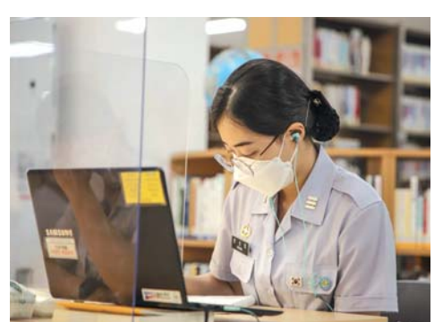
▲ 노트북으로 온라인 수업을 듣고 있는 3학년 생도