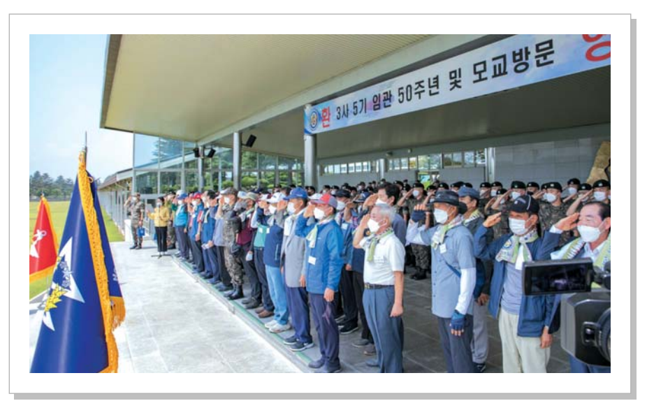
▲ 충성연병장 시열대에서 기념행사 식순에 맞춰 국민의례를 하고 있다.