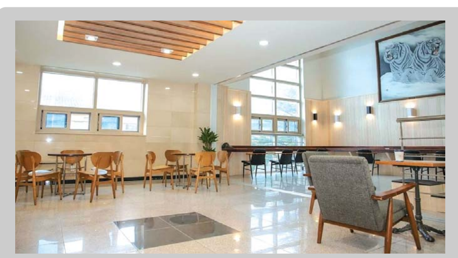
▲ 학무관 스터디 카페(Study Cafe) 내부전경 1