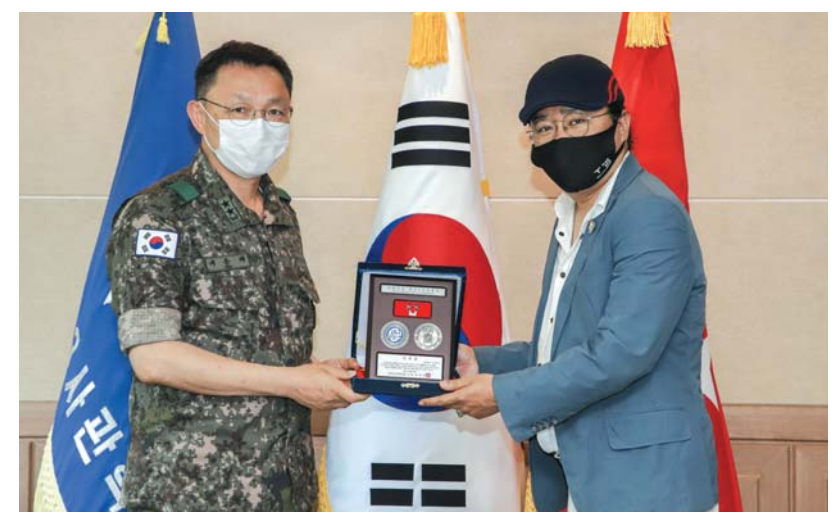
▲ 학교장(소장여운태)이 김한민 감독에게 홍보대사위촉패를 전달하고 있다.

대한민국 역대 최다 1,700만 명 흥행 스코어를 기록했던 기념비적인 영화 '명량'의 김한민 감독이 육군3사관학교 홍보대사로 위촉됐다.