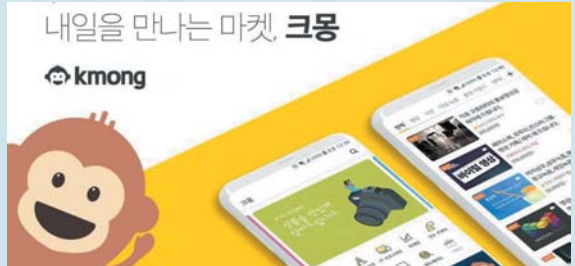
대표적인 재능기부 플랫폼 탈링, 크몽

에 대한 불안에는 역설적으로 현재에 집중하게 하는 경향이 있다. 자본주의 키즈들은 이에 대해 영리하게 접근하는데, 마음속의 장부를 유연하게 활용하여 '가 격 대비 마음의 비용'인 가심비를 극대화한다.