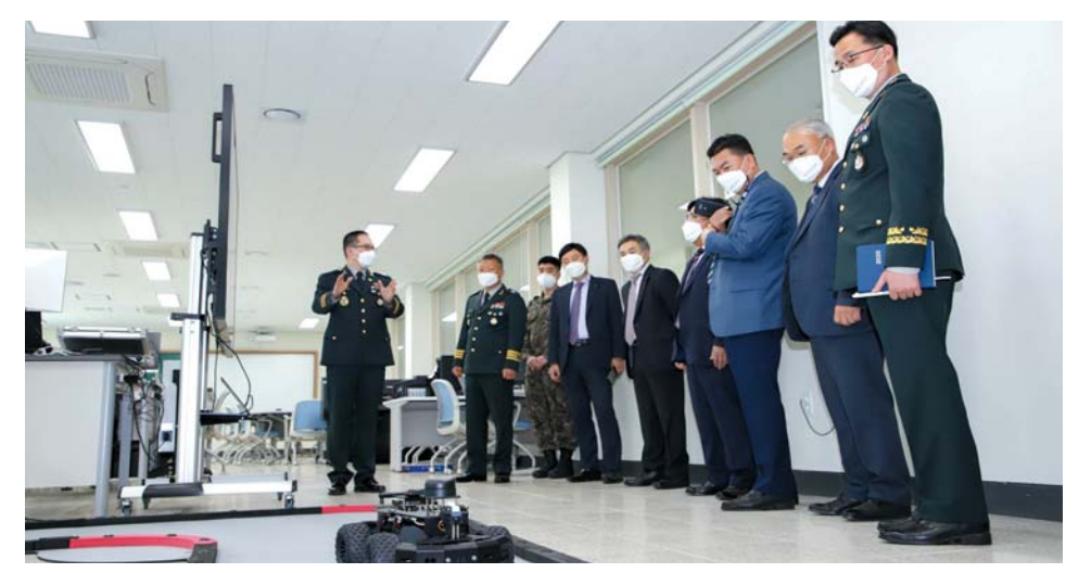
▲ 창의융합공학실에서 UG넥스원 관계자들을 대상으로 4차 신업혁명 관련 첨단실험장비를 소개하고 있다.