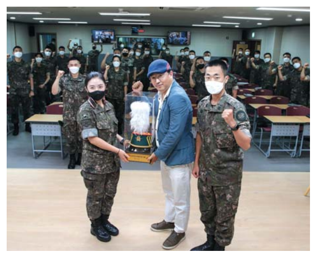
▲ 생도들이 예모를 기념품으로 전달하고 있다.

▲ 대한(大韓)이라는 말이 무엇을 뜻하는지 아시나요? 대한은 삼한을 일컫는 다른 말로써 한반도 전역을 이르 는 말입니다. 이는 국가의 정체성을 규정하는 개념이기 도 합니다. 이순신 장군이 조선이라는 나라를 수호하기 위해 노력했듯이 여러분들도 대한의 뜻과 진정한 대한민 국의 의미가 무엇인지 기슴 속에 지닌다면 위급한 상황 속에서 영웅적인 면모가 자연스럽게 나올 것입니다.