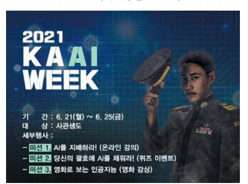
▲ KAAIWeek 포스터

코로나 19 사회적 거리두기를 고려해 전기간 그룹별 온라인으로 진행된 이번 교육의 프로그램은 AI·Big Data 기초과정과특강으로 구분하여 AI 입문, 사물인터넷, 데이터 사이언스, 컴퓨팅 사고, 데이터 사